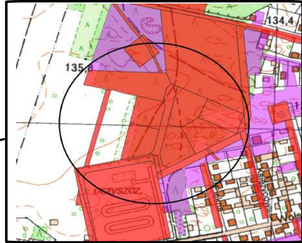
Lokalizacja tzw. "działki po Gizehu"