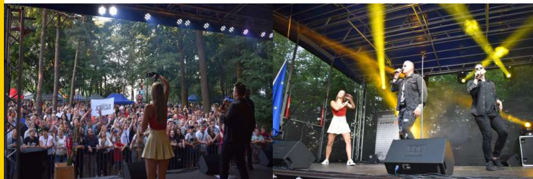
Zabawa z zespołem Jorrgus