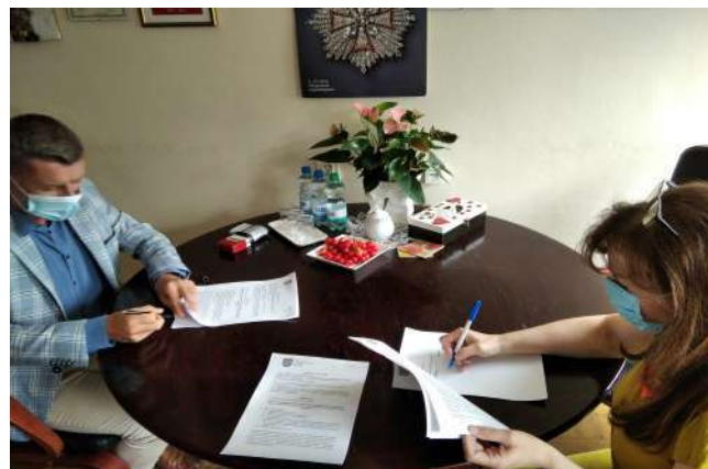
Podpisanie umowy na projekt hali sportowej z przedstawicielem firmy "Kowalczyk Architekci" z Łodzi.

Więcej informacji na stronie internetowej: www.miastolaskarzew.pl w zakładce SPORT.