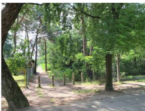
Widok na drogę dojazdową – ul. Przedszkolna