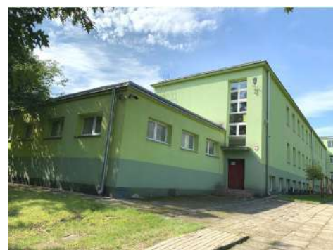
Widok szkoły od strony planowanego łącznika

Planowana inwestycja przewiduje budowę hali sportowo – widowiskowej. Ma ona służyć zarówno uczniom Zespołu Szkół nr 1 im. Szarych Szeregów, jak też wszystkim mieszkańcom Miasta jako miejsce rekreacji i wypoczynku. Komunikacja między szkołą a salą zapewniona będzie dzięki nadwieszonemu nad istniejącym dojazdem łącznikowi. Przewiduje się, że będzie on prowadził z istniejącej (bocznej) klatki schodowej szkoły.